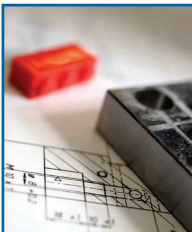
Les dessins de détail