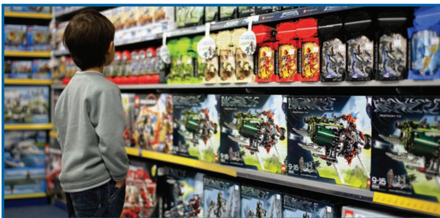
La mise en marché